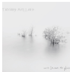
UNE LARME DE PLUIE SEPT 2022