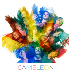
ENSEMBLE CAMÉLÉON MARS 2022