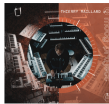
MOOG PROJECT AVRIL 2023