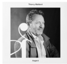
ASGARD SEPT 2023