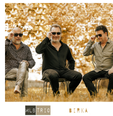
MLB TRIO BIRKA NOVEMBRE 2021